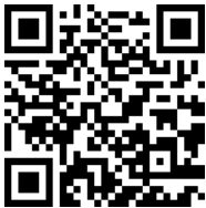
QR-код содержит ссылку на данный документ в ЭКБ НПА РК